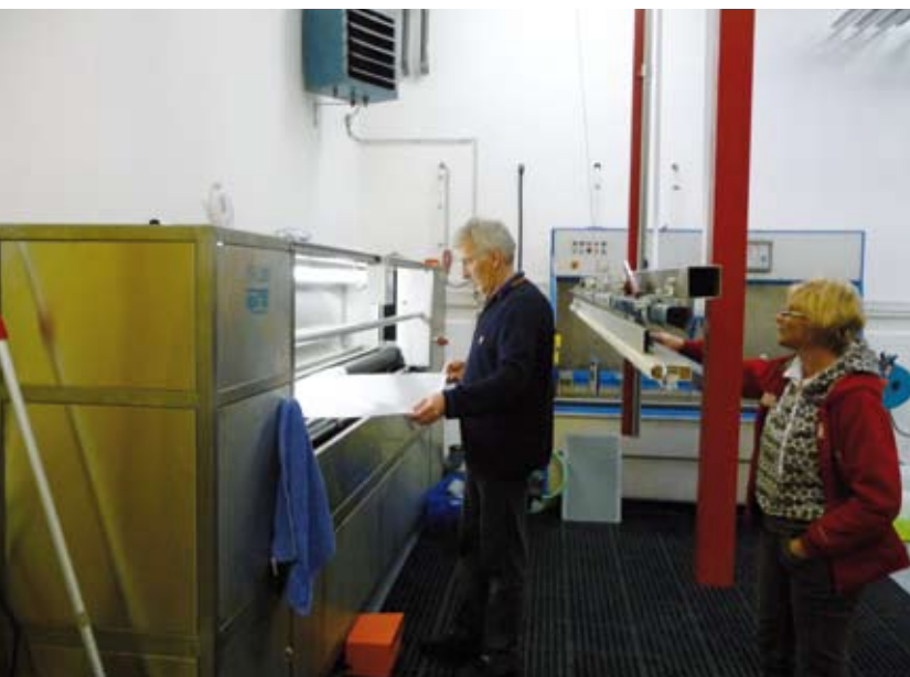
Ein Vollautomat reinigt Flächenvorhänge, Rollos, Plissees, Screenflächen und technischen Textilien.

Das Beispiel der Firma Sonnenschutztechnik Schilling zeigt, wie sich ein Unternehmen durch Spezialisierung in einem neuen Marktsegment erfolgreich entwickeln konnte. Sonnenschutztechnik Schilling, mit Sitz in Essen, wurde 1992 gegründet. Am Anfang stand der Verkauf und die Montage von innen liegendem Sonnenschutz wie Jalousien, Lamellen und Rollos. 1995 kam der Bereich Außenjalousien dazu. Bald kamen die ersten Kundenanfragen hinsichtlich der Reinigung. „Ich erinnere mich noch gut, wie wir die ersten Außenjalousien mit der Autowaschbürste und von Hand gereinigt haben,“ erzählt uns