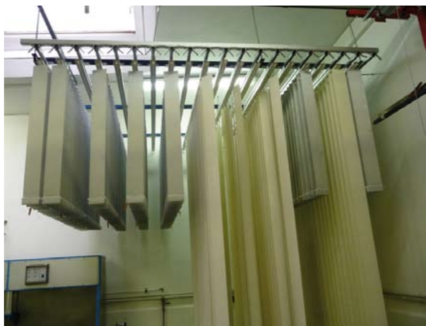
Vertikal-Lamellen nach einer professionellen Reinigung durch das Unternehmen.