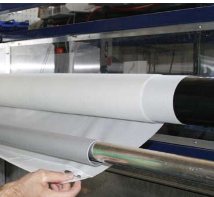
Die Ergebnisse überzeugen.